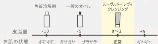
シーバムメーター(皮膚残存脂量測定)によるお肌の状態比較

◀ 皮脂・角質の落としすぎ 角質の正常化 ▶ ※肌トラブルの一番の原因はクレンジングだったので。